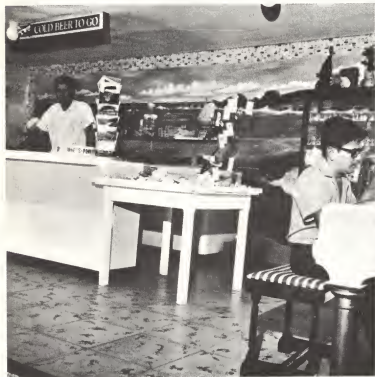
Vista interior di Natural Bridge Snackbar. Un ganashi nobo y estimulo pa desaroyo Turistica na Aruba. Prueba palpable cu cu cooperacion hopi por ser logra.

Bestuurscollege di Aruba naturalmente no a laga esaki drumi y mesora a hasi tur su posibel pa realiza e skool aki pa e pueblo di Noord.